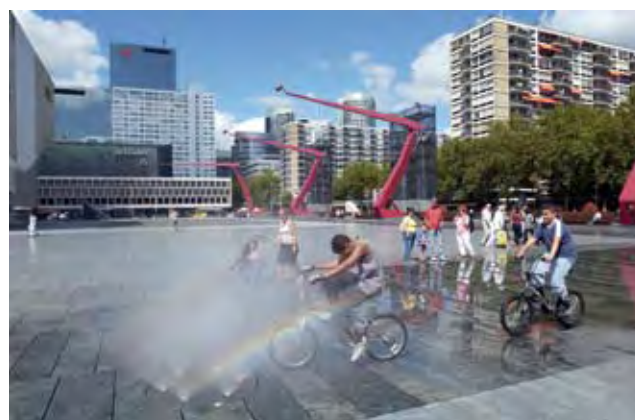
Spelende kinderen Schouwburgplein R'dam

Een deel van de opbrengst van alle inzamelingsacties voor Rotterdam Unicef Stad gaat naar het Rotterdamse project 'Kindlint'. Kindlint is een route waarlangs kinderen zelfstandig, veilig en prettig naar allerlei opvang-, onderwijs en vrijetijdsvoorzieningen kunnen lopen of fietsen. Het doel van Kindlint is dat kinderen zelf op pad kunnen; spelend van de ene plek naar de andere.